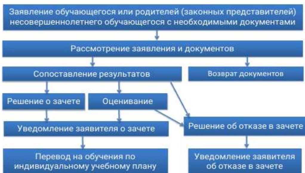
Рисунок 1 - Алгоритм действий образовательной организации по реализации процедур зачета результатов обучения в другой образовательной организации.